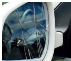
En incident föranledde studiebesök på tre tyska Porsche Center.

Dagen därpå hittar vi av en ren slump den ena Piaggion, en orange skapelse som jag inte kan låta bli att föreviga.