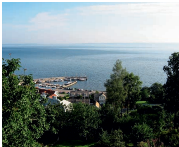
Hamnen är hjärtat i Arild. I klart väder ser man Hallands Väderö i horisonten.

Väl i Tyskland kommer vår första utmaning. Vi ska använda PCM, Porsche Communication Management, för att guida oss till Berlin. Med en instruktionsbok tjock som ett uppslagsverk ger vi snabbt upp och övergår till