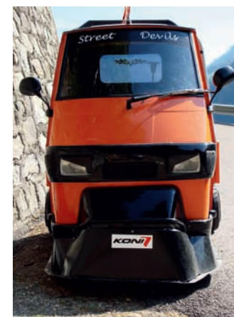
Terrorverktyg från Untental. Ljudeffekt känd, motoreffekt okänd.

NÄSTA STOPP PÅ VÅR ODYSSEÉ är Untental, en trång dalgång öster om Meran i Südtirol. I dalen finns tre byar och vi stannar mest av en slump i den första, St Walburg. Vårt härbärge för natten, Gasthof Eggwirt, ligger mitt i byn och middagen avnjuts på deras terrass ovanför torget. Vi har osedvanlig tur, samma kväll är det byfest, med långbord och ompa-ompamusik. Vi sitter länge och betraktar skådespelet under oss. När vi så småningom kommer i säng störs vi av ett synnerligen ettrigt ljud. Det upprepar sig gång på gång. Det är några som kör något fram och tillbaka genom byn. Det låter som mopeder, fast ändå inte. Till slut kan jag inte hålla mig utan jag måste upp och titta, jag tror knappt mina ögon. Genom byn far som bålgetingar två trehjuliga Piaggio Ape; en typ av minilastbil som det vimlar av i Italien. ”Mopedruggarna” i byn har alltså inte moppar utan ”lastbilar”. Jag kan inte låta bli att le för mig själv, när jag tänker på hur många de här två lyckats irritera denna sena kväll.