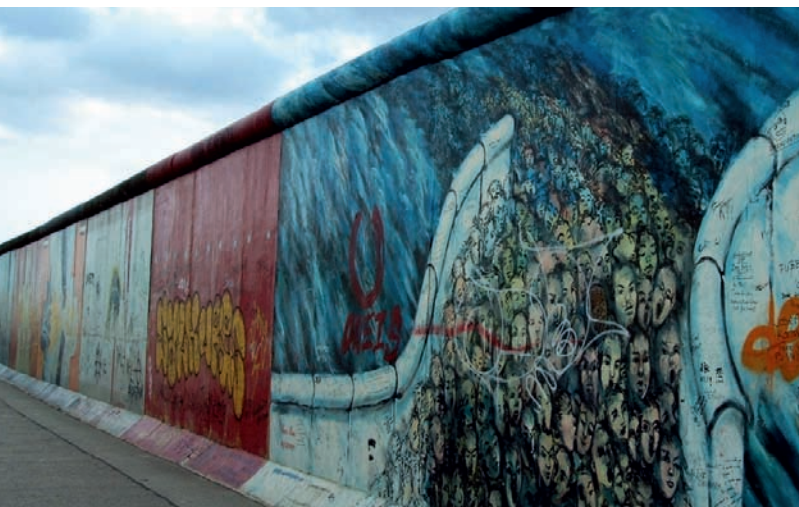
En rest av Berlinmuren, East Side Gallery, med målningar av olika konstnärer.